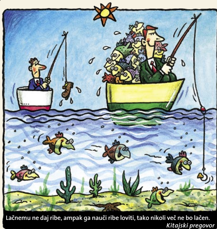
Lačnemu ne daj ribe, ampak ga nauči ribe loviti, tako nikoli več ne bo lačen. Kitajski pregovor

Tako NŽZ, ENZ kot JUNIOR omogočajo aktivnejši pristop k zavarovanju. Z izbiro investicijskega sklada in s tem naložbene politike omogočajo zavarovalcu aktivno sodelovanje pri upravljanju njegovega premoženja in posredni vstop na kapitalski trg. Na daljši rok praviloma prinašajo višje donose, hkrati pa ohranjajo ugodnosti življenjskih zavarovanj. Ob doživetju zavarovanja prejme upravičenec za doživetje zavarovalno vsoto, ki je enaka vrednosti privarčevanega premoženja na naložbenem računu zavarovalca. Pri zavarovanju JUNIOR je upravičenec za osnovno zavarovanje vedno otrok. Zavarovanje je namreč namenjeno varčevanju za prihodnost otroka.